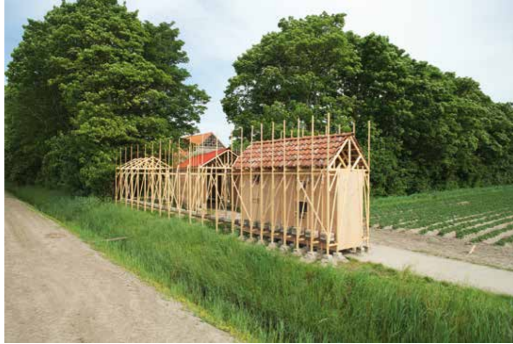
2017 HERBERGEN, TEMPORARY PAVILION IN THE NOORDOOSTPOLDER