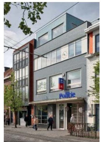
Politiekantoor, Antwerpen

Dit is goed zichtbaar in het politiekantoor in Antwerpen. Op architectonisch niveau is het gebouw een herneming van de herkenbare typologie van een stadshuis met koetspoort. De licht blauwe gevel is een verwijzing naar het programma. Behalve de gangbare aankondiging zijn subtiel de letters politie uitgespaard in de betonnen luifel boven de ingang, als natuurlijke lichtreclame op het trottoir. Het uurwerk verwijst op klassieke manier naar de functie als civiel gebouw. In het oog springt het siersmeedwerk, dat de suggestie wekt van fragiliteit. Deze symboliek druist volledig in tegen het idee van de politie als ferme macht. En dat kan dan met terugwerkende kracht ook over de gevelkleur gezegd worden. Ironie is op zijn plaats als het gaat om de huisvesting van dit soort instituten.