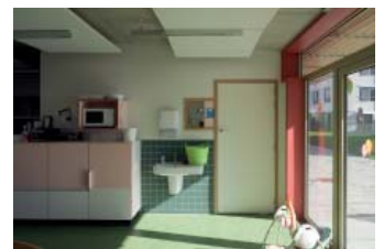
Kinderdagverblijf IGLO, Antwerpen

De Smet Vermeulen weet bestaande conventies te verrijken en verruimen. Deze optelsom leidt tot een ongekende gelaagdheid.