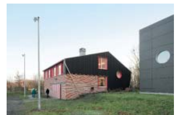
Natuurpunt Bourgoyen, Gent

Bedankt voor uw aandacht. Van harte gefeliciteerd met de mooie tentoonstelling, en veel plezier met het bezoek.