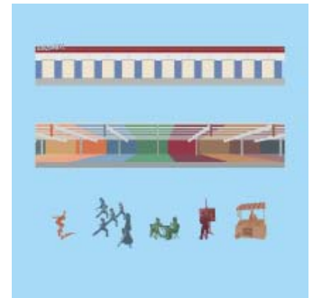
Reuzenhal, From Cure to Care

Terug naar de stedenbouw. Ik ben verrast door hun studie voor de Internationale Architectuur Biennale in Rotterdam. Vanwege het strategische karakter lijkt het niet te passen binnen de lijst met projecten. Onderwerp van studie is de Gezonde Stad. Centraal staat de wijk Overvecht, die slecht scoort op gezondheid. De Smet Vermeulen grijpt een half uitgevoerde sloop aan om het thema gezondheid verder op te rekken. De gebouwen die van de sloop zijn gered, zijn ingenomen door allerlei sociale initiatieven. Deze worden nu door de gemeente bedreigt met uitzetting. Het opnieuw plaats geven aan deze initiatieven moet een zinrijke buurt opleveren. Hiermee poneert De Smet Vermeulen dat De Gezonde Stad niet alleen groen, schoon of beweeglijk is, maar vooral ook sociaal. Dit vormt vervolgens de basis voor een reeks voorstellen. Een moestuin, co-housing woningen, zorgwoningen met daaronder kleinschalige buurtvoorzieningen, een jeu-de-boulesbaan.