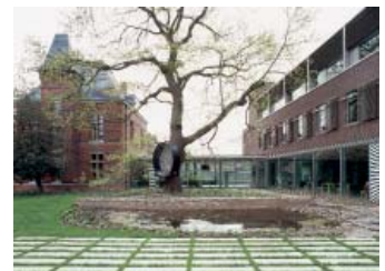
Vlaamse Milieumaatschappij, Aalst