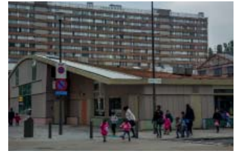
Kinderdagverblijf IGLO, Antwerpen

Een goed voorbeeld hiervan is de omhulling van de afvoerpijpjes op het dak van het kinderdagverblijf. Het gaat niet om het wegwerken van deze pijpjes, maar juist de vergroting van het gebaar. In gedachten kan je de schoorstenen verbinden met een kachel binnen, die warmte geeft, geborgenheid symboliseert. Deze symboliek past goed bij de aard van het programma.