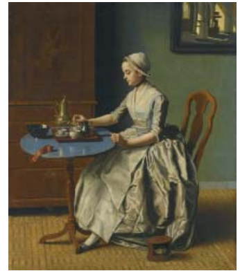
Een Hollands meisje aan het ontbijt Schilder: Jean-Étienne Liotard, 1773

Ook op een ander vlak is er een analogie tussen het werk van Liotard en De Smet Vermeulen. De schilder maakte meestal verfijnde pastels. Dit is een techniek waarbij de maker dicht op het doek zit en nauwkeurig strepen trekt. De Smet Vermeulen lijken in hun detaillering net zo goed dicht op het gebouw te zitten, en hele fijne streken te trekken in bijvoorbeeld de expressieve lekdorpels boven en onder de raamopeningen.